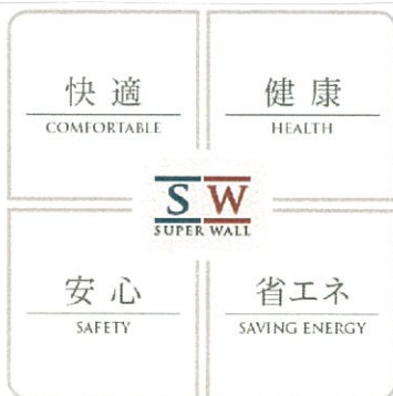
スーパーウォール工法って何?