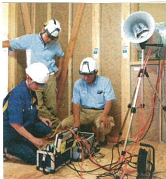
気密検査のようす。